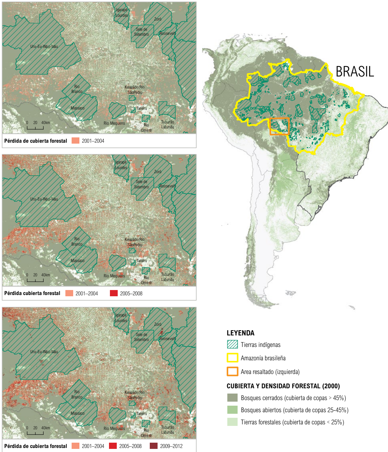
Gráfico 3 | Pérdida de cubierta forestal detectada vía satélite en Brasil entre 2000 y 2012, dentro de las tierras indígenas en el suroeste de la Amazonía brasileña

Fuente: Los datos sobre la pérdida de cubierta forestal provienen de Hansen y otros, 2013, y describen cambios forestales con una resolución espacial de 30 metros sobre el globo terráqueo. Los datos sobre las tierras indígenas provienen de la Fundación Nacional del Indio (FUNAI), adscrita al Ministerio de Justicia (Fundação Nacional do Índio, 2013). Hay 371 tierras indígenas en la serie de datos, que incluye tanto tierras reconocidas plenamente como aquellas todavía en proceso de registro. NOTA: Los datos de la FUNAI sobre tierras comunitarias registran unos 35 millones de hectáreas menos que los datos de RRI. La razón de esta discrepancia es que los datos de la FUNAI corresponden a las tierras indígenas no a otros tipos de tenencia, como en el caso de RRI: reservas extractivas, reservas para el desarrollo sostenible, proyectos de asentamientos agro-extractivos, proyectos de asentamientos forestales, proyectos de desarrollo sostenible y tierras de quilombolas (pueblos de descendencia africana).